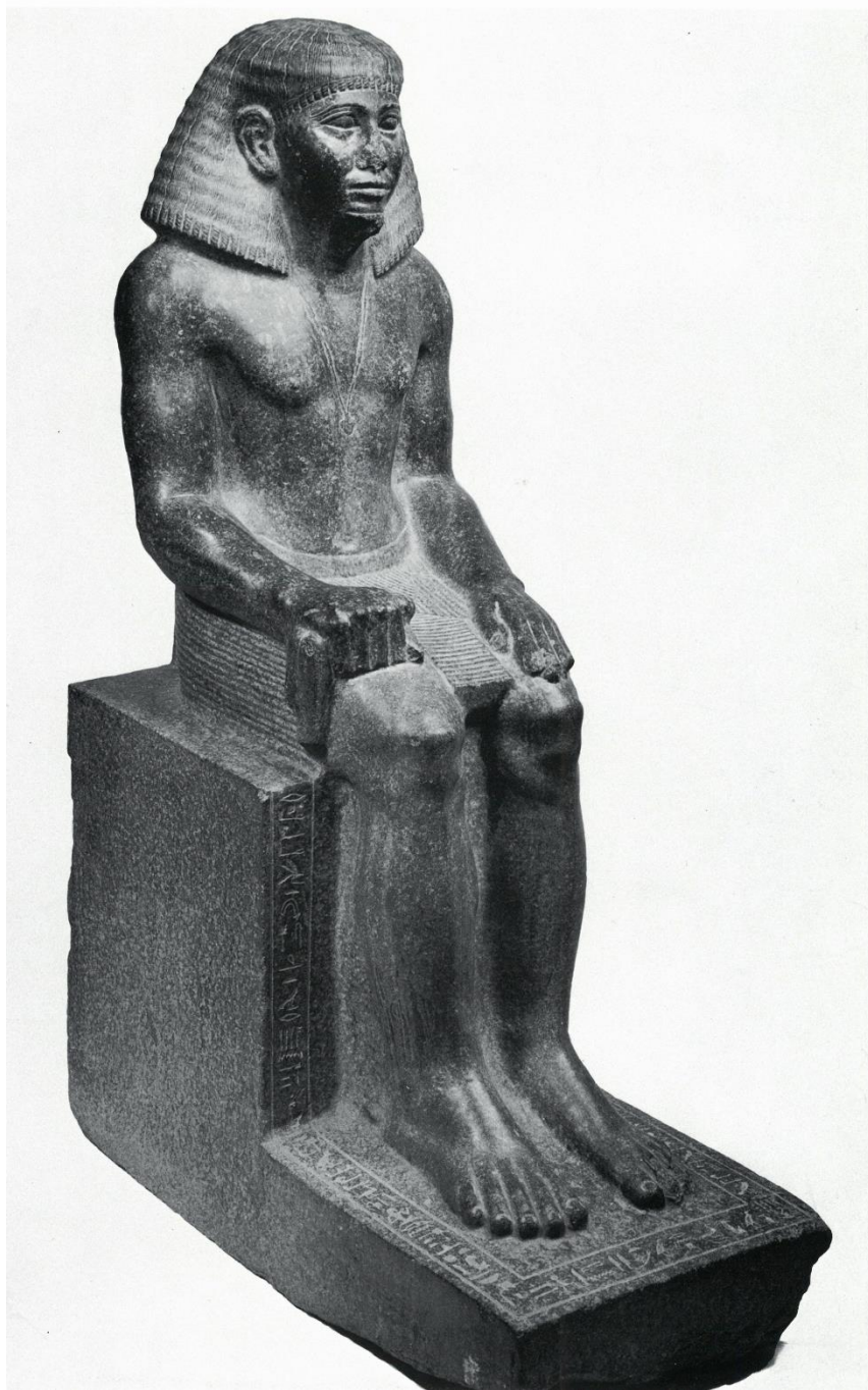
Figuur 4. Beeld van gouverneur Sarenput II, uit Elefantine, donker graniet, 120 cm hoog