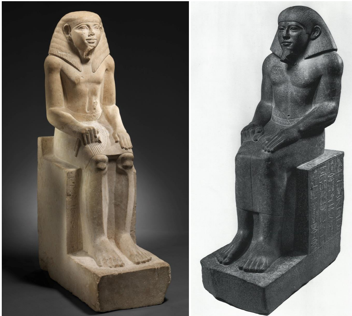
Figuur 5. Rechts: Beeld van Sehetepibreanch, uit Lisjt, kalksteen, 95 cm hoog, (ca. Amenemhat II).

Hierbij moet vermeld worden dat het beeld van Sarenput van een ander materiaal is (donker graniet) en een andere functie had. Desalniettemin komen de afmetingen van dit beeld, en andere contemporaine beelden (zie figuur 5), niet in de buurt van het beeld van Djehutyhotep.