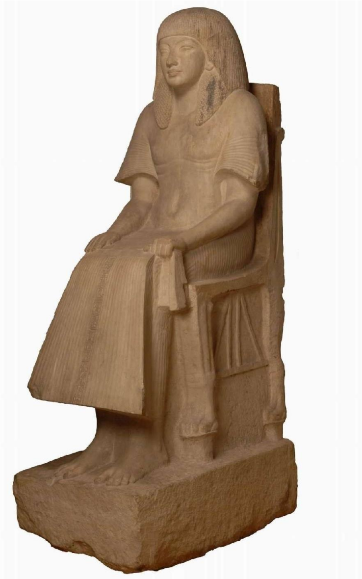
Figuur 3. Beeld van Maya, uit Saqqara, kalksteen, 216 cm hoog

Djehutyhotep's beeld is nooit teruggevonden, en daarom is het niet volledig zeker of het daadwerkelijk bestaan heeft. Als we aannemen dat de beschrijving van het beeld in het graf op waarheid is gebaseerd, dan is de grootte van de sculptuur uniek voor een niet-koninklijk individu. Voor zover bekend zijn de meeste beelden van private personen kleiner dan levensgroot of levensgroot. Een minderheid is iets groter dan levensgroot, zoals het veel latere beeld van Maya in het Rijksmuseum van Oudheden in Leiden.