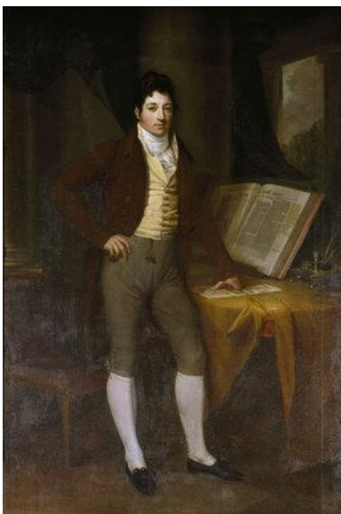
Somerset Lowry-Corry.

Somerset Lowry-Corry (1774-1841) was een edelman en politicus. Van 1798 tot 1801 was hij lid van de Irish House of Commons voor het graafschap Tyrone. Van 1801 tot 1802 was hij lid van de British House of Commons. In 1802 volgde hij zijn vader Armar Lowry-Corry op als de Graaf van Belmore. Hiermee erfde hij ook Castle Coole, dat nog steeds te bezichtigen is in Enniskillen, Noord-Ierland. Ondanks de schulden die hij ook van zijn vader erfde liet hij het immense gebouw renoveren.