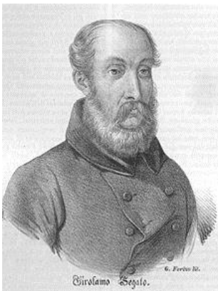
Girolamo Segato.

Girolamo Segato (1792-1836) was een Italiaanse wetenschapper die zich bezighield met het Oude Egypte en de anatomie van de mens. Deze twee interesses kwamen samen in zijn onderzoek naar mummificatie en de verschillende technieken die hierbij gebruikt werden. Vanaf 1818 nam hij meerdere keren deel aan expedities naar Egypte waarbij vooral mummies zijn aandacht kregen.