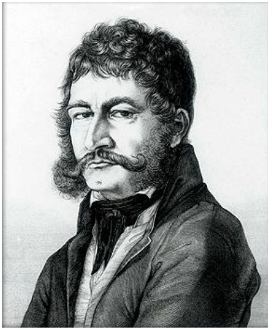
Bernardino Drovetti.

negatieve toon. Hij en zijn agenten zouden andere onderzoekers en verzamelaars zoals Belzoni, Salt en Champollion flink dwars hebben gezeten en hardhandig hebben behandeld.