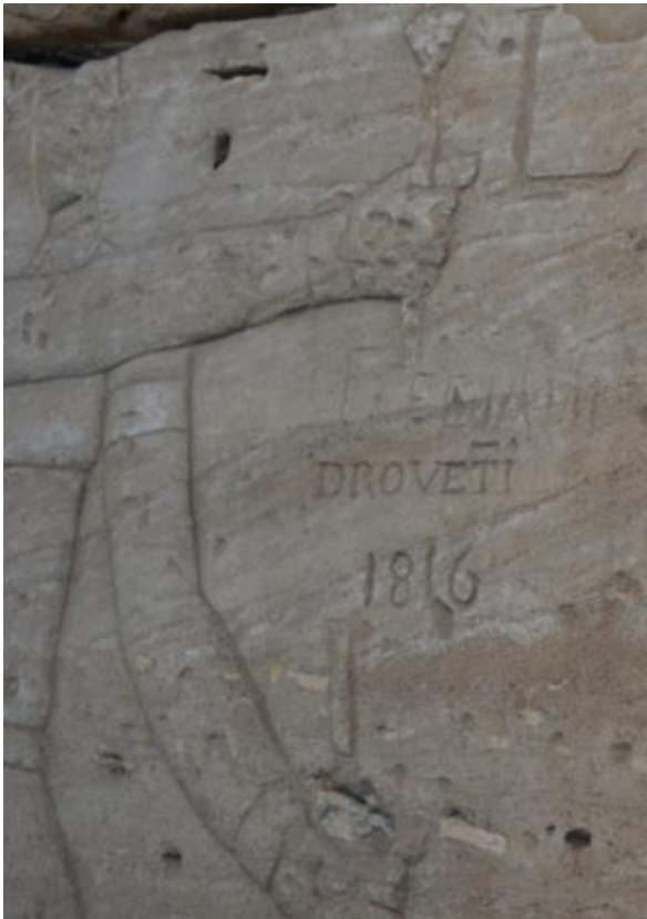
Graffito van Bernardino Drovetti in de tempel van Dendur.