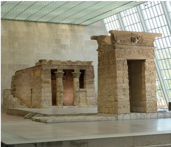
De Tempel van Dendur in de Sackler-vleugel van het Metropolitan Museum of Art, New York.

In 1960 begon Egypte met de bouw van de Hoge Aswandam. Hierdoor werd de jaarlijkse overstroming gereguleerd en kon er elektriciteit worden opgewekt. De bouw van de dam creëerde echter ook een groot stuwmeer dat vele monumenten bedreigde met overstroming. Om zoveel mogelijk van deze kostbare gebouwen te behouden startte UNESCO een spraakmakende reddingsactie waarbij vele tempels ontmanteld werden. Bekende tempels als die van Aboe Simbel en Philae werden buiten bereik van het water teruggeplaatst op een wijze die niet doet vermoeden dat ze niet op hun oorspronkelijke locatie staan.