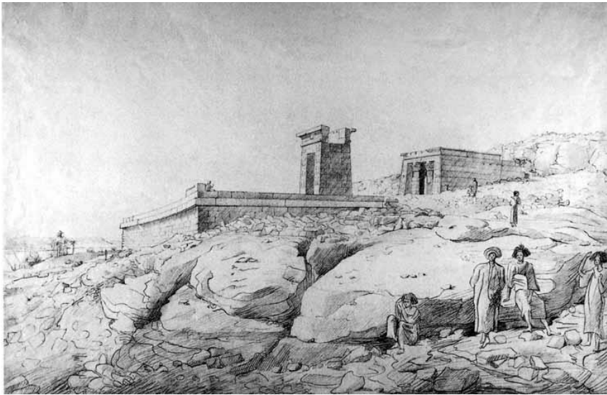
De Tempel van Dendur in Egypte zoals getekend door Henry Salt.

Nadat keizer Augustus in 31 voor Christus de eigendommen van alle tempels in beslag nam en hun bestuur centraliseerde liet hij als een vorm van compensatie meerdere tempels bouwen gewijd aan lokale goden. De tempel van Dendur is een van deze tempels en is rond 10 na Christus voltooid. De tempelmuren tonen uiteraard de keizer en Egyptische goden, maar is tevens gewijd aan Pedesi en Pihor, lokale prinsen die om het leven kwamen. Het lichaam van Pedesi zou aangespoeld zijn bij Dendur en daar begraven zijn. Hij krijgt dan ook een prominentere rol op de tempelmuren dan zijn broer. 2