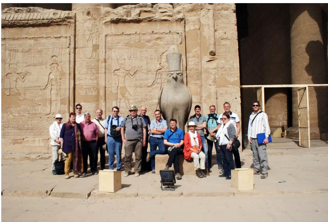
Groepsfoto voor de tempel van Edfoe, Egyptereis januari 2017.