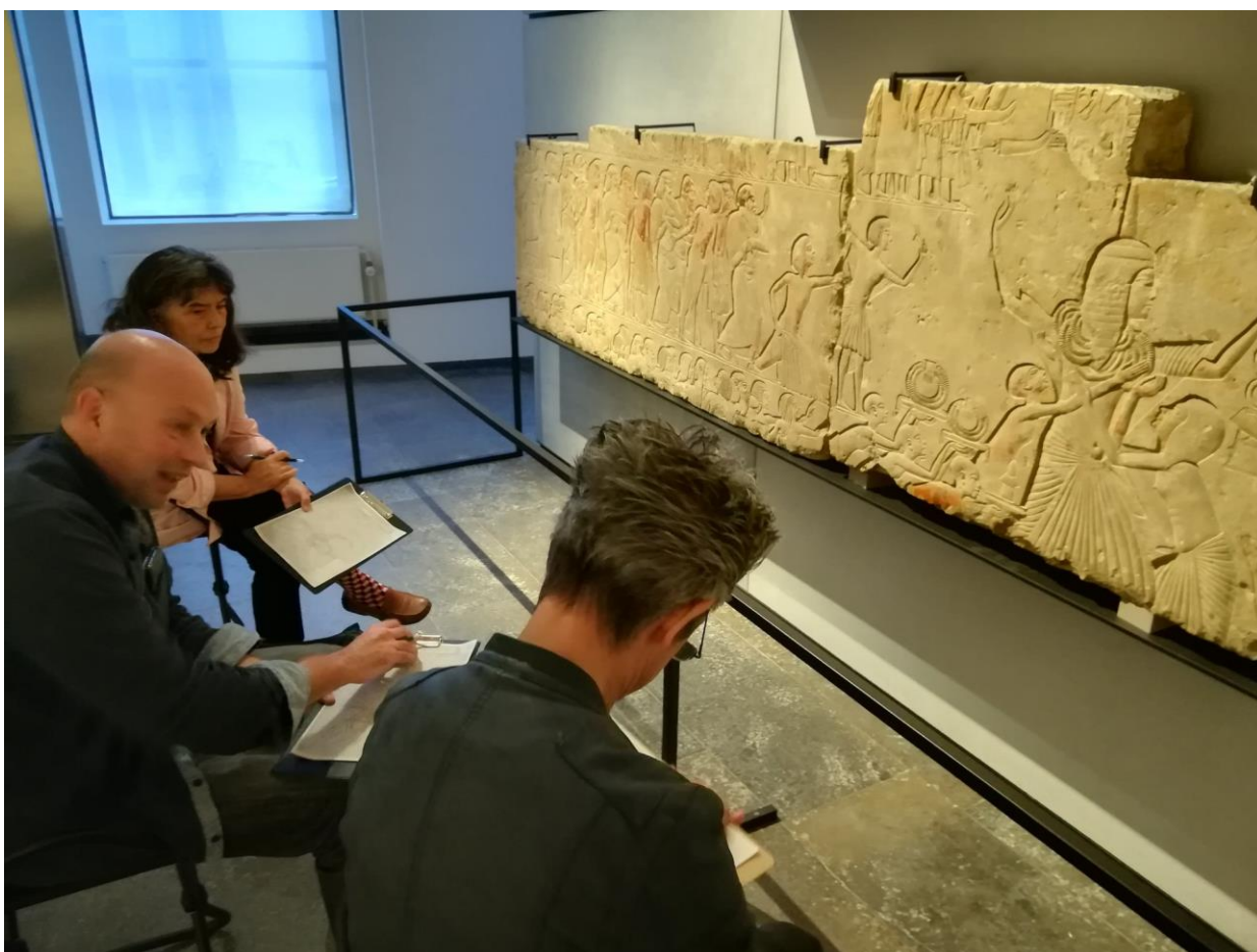
Workshop Egyptische epigrafie